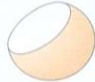
SEGMENTO ESFERICO DE UNA BASE