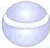
SEGMENTO ESFERICO DE DOS BASES