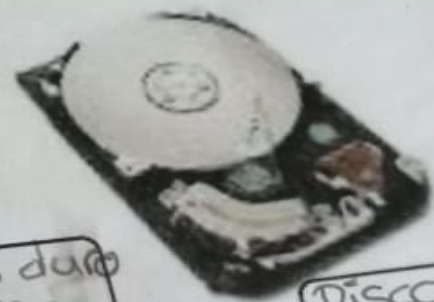
Disco duro Interno