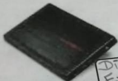
Disco duro Externo