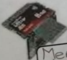
Memoria sd y Microsd