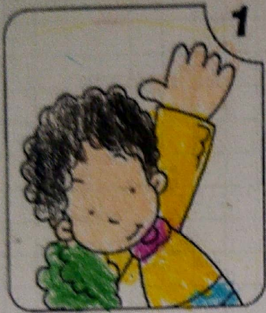
LEVANTO LA MANO PARA HABLAR