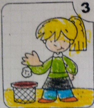
NO TIRO PAPELES AL SUELO