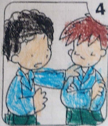
PIDO DISCULPAS SI ME EQUIVOCO