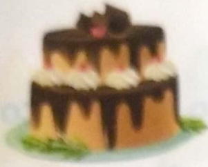
pas - tel