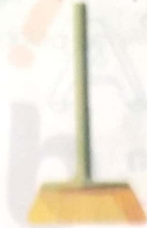
es - co - ba