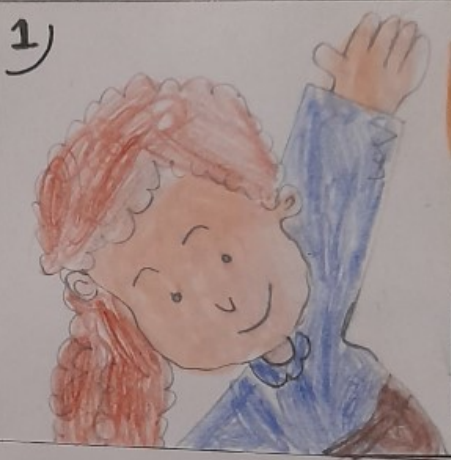
LEVANTO LA MANO PARA HABLAR