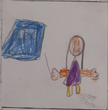
Prestar atención al tablero