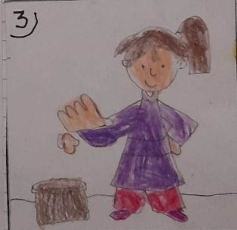
No TIRO PAPELES AL SUELO