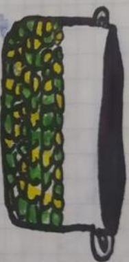
albergas y garbanzos