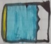
agua y arena