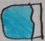
agua con alcohol