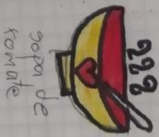
sopa de tomate