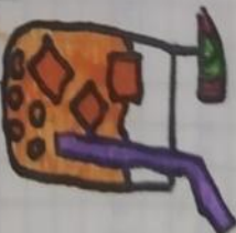
hielo en bebida carbonatada

la forma de saber si es una mezcla heterogenea es observando. si tiene dos o mas componentes visibles. Por ejemplo un plato de arroz con lentejas, cena fria con leche, coca cola con hielo, una mezcla