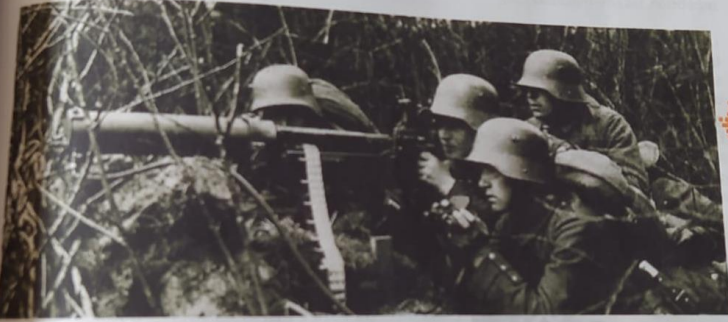
Imagen de la primera guerra