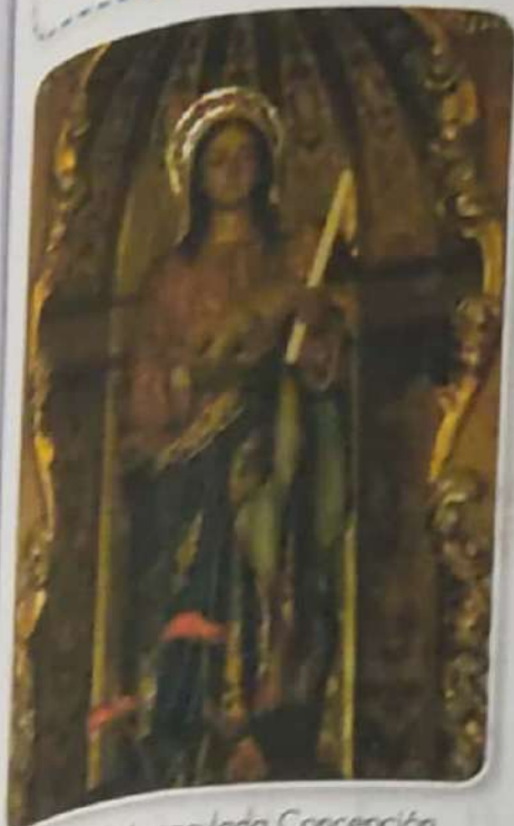
Ilige de la Inmaculada Concepción.

Las fiestas de la religión cristiana eran: