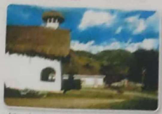
Antigua iglesia colonial de San Andrés de Pastora en Tumbuco, Nariño. En ella los indígenas mantuvieron la estructura española.

Por esta razón la Iglesia a través del Tribunal de la Inquisición persiguió y castigó a los paganos.