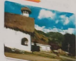
Antiguo templo católico de San Andrés de Tumbaco, en Tumbaco, Písa. En él se conservan las estructuras españolas.

Por esta razón la Iglesia a través del Tribunal de la Inquisición persiguió y castigó a los paganos.