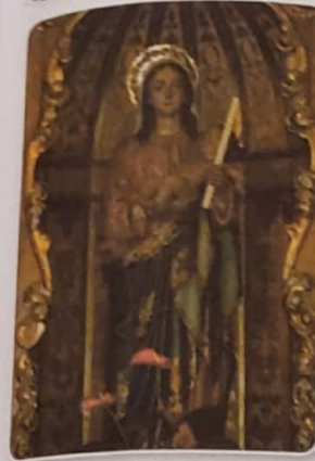
Virgen de la Inmaculada Concepción.

Las fiestas de la religión cristiana eran: