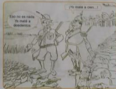
Ricardo Rondón. Regreso de la cacería. Abadía Méndez y el general Cornejo Vargas comparan resultados de cacería, después de la masacre de las bananeras. Álbum Cromos, 1930.

3 Observa la caricatura referente a la masacre de las bananeras, analiza con tus compañeros su posible significado y escribe su interpretación.