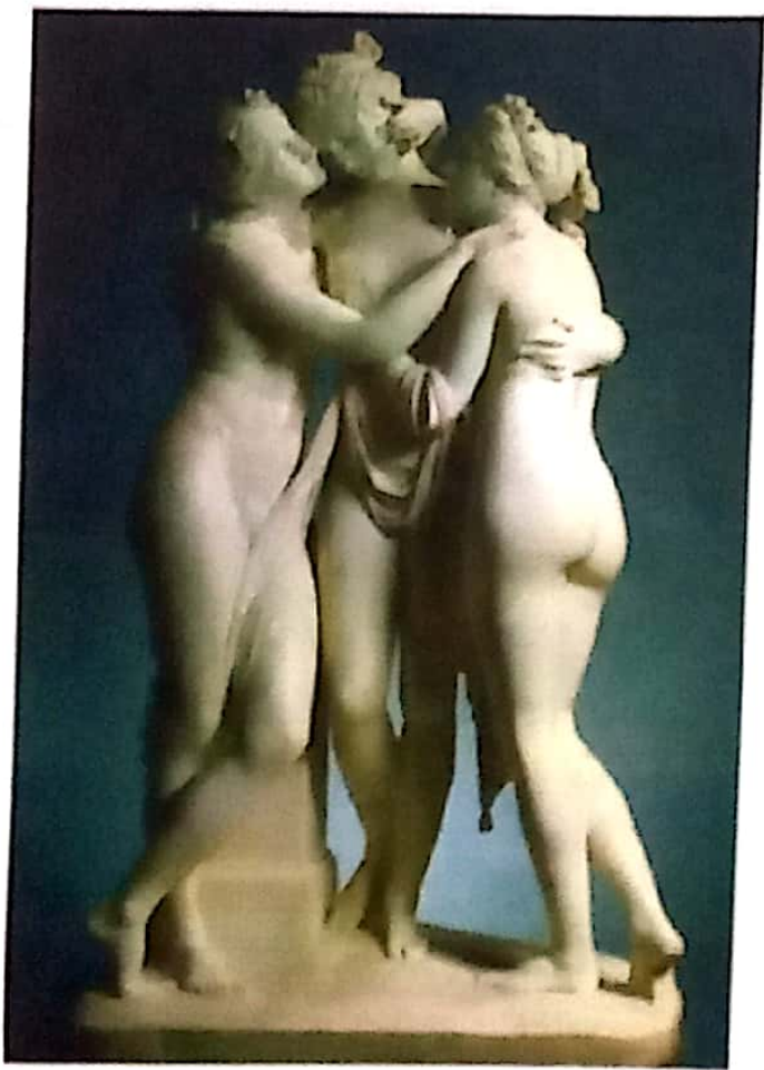
Las tres gracias, de Antonio Canova

4 Completa el siguiente cuadro expresando tu opinión acerca de la siguiente obra.