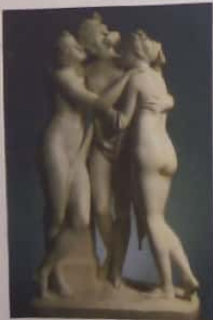
Las tres gracias, de Antonio Canova

Completa el siguiente cuadro expresando tu opinión acerca de la siguiente obra.