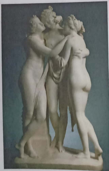
Las tres gracias, de Antonio Canova

4 Completa el siguiente cuadro expresando tu opinión acerca de la siguiente obra.