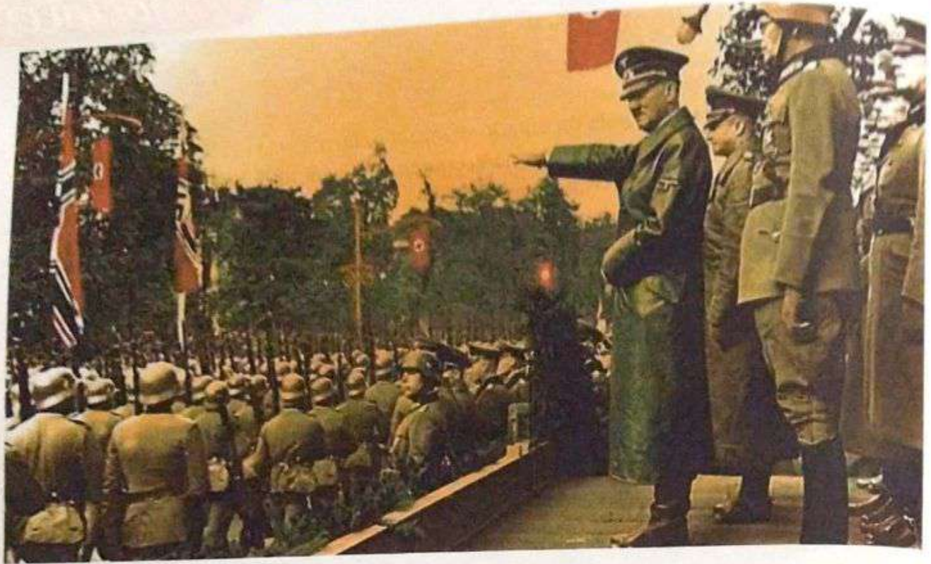
Hitler en la Segunda guerra Mundial okdiario.com/curiosidades/5-datos-aterradores-segunda-guerra-mundial-661331