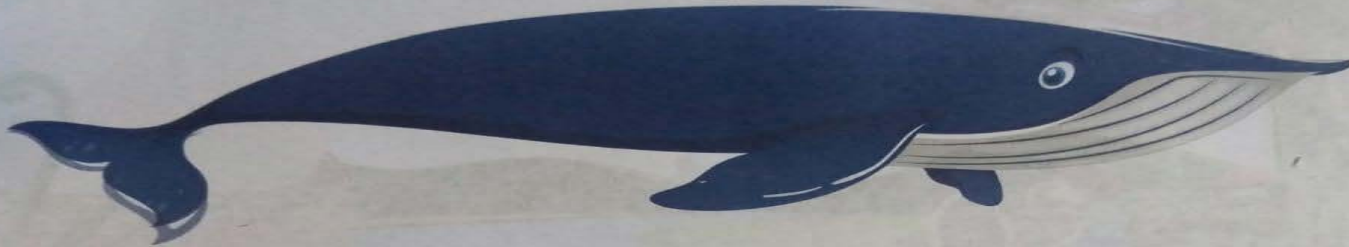
Ballena Azul 33 Metros