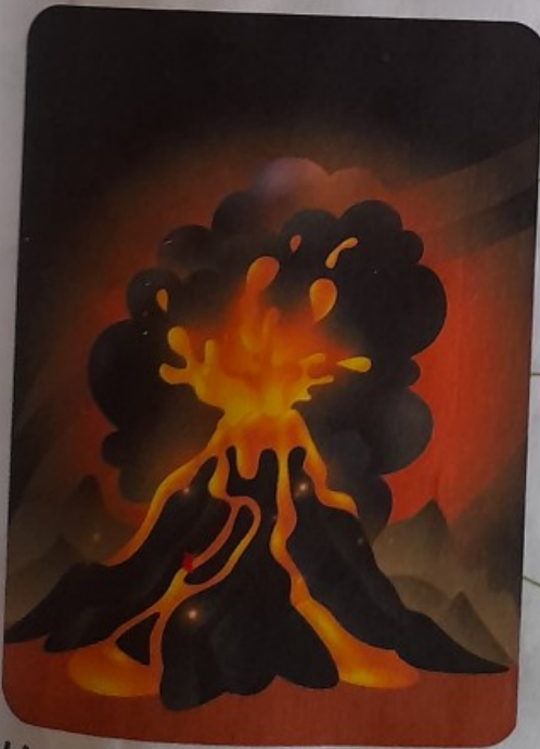
UNA ERUPCIÓN VOLCÁNICA

¿Qué hacer después? 1. Verifica el estado de tu casa o trabajo antes de reingresar.