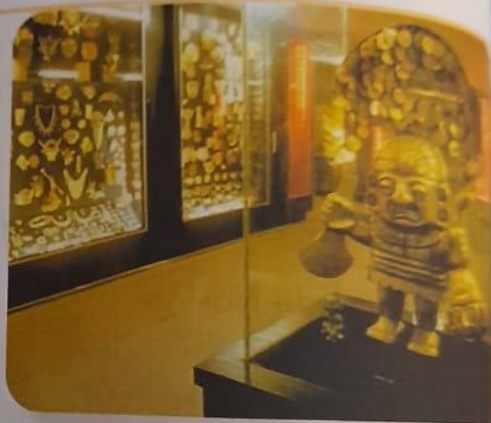
Museo del Oro

El museo fue inaugurado en 1968... su fin es la adquisición, conservación y exposición de piezas de orfebrería y alfarería de culturas indígenas del periodo