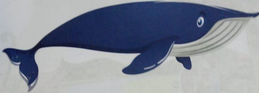
Ballena Azul 33 Metros