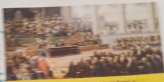
... en la ciudad de México, durante el proceso de redacción de la Constitución.

... por el deseo de unificar el país y establecer una constitución que sirviera de base para el futuro desarrollo del país. Este documento es la base de la actual Constitución de México.