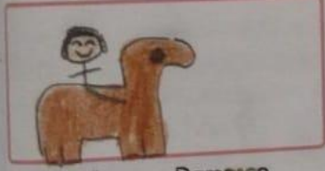
Lo llevan a Damasco