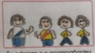
Se admiran sus acompañantes