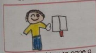
Recobra la vista y se pone a predicar