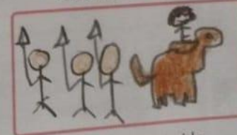
Pablo es perseguido