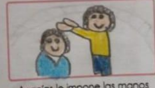
Ananias le impone las manos