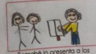
Barnabé lo presenta a los apóstoles