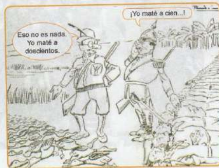
Ricardo Rondón. Regresa de la cacería. Abadía Méndez y el general Cortés Vargas comparan resultados de cacería, después de la masacre de las bananeras. Álbum Cromos, 1930

3 Observa la caricatura referente a la masacre de las bananeras, analiza con tus compañeros su posible significado y escribe su interpretación.