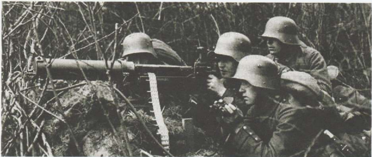
Imagen de la primera guerra