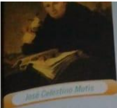
José Celestino Mutis

... desde el exterior. Se muda a Bogotá, donde funda y dicta la cátedra de matemáticas en el Colegio Mayor. Es en esta época cuando entra en contacto con los círculos ilustrados de la ciudad, con quienes defiende la creación de una universidad ilustrada, escindida del control eclesiástico. Entre sus contribuciones al saber de la época, destacan, la creación de una enorme colección de dibujos de la flora colombiana, la elaboración de un diccionario con palabras elementales utilizadas por los aborígenes de la zona, y numerosas aportaciones en áreas tan diversas como la industria, la medicina, la minería y la destilación de bebidas alcohólicas.