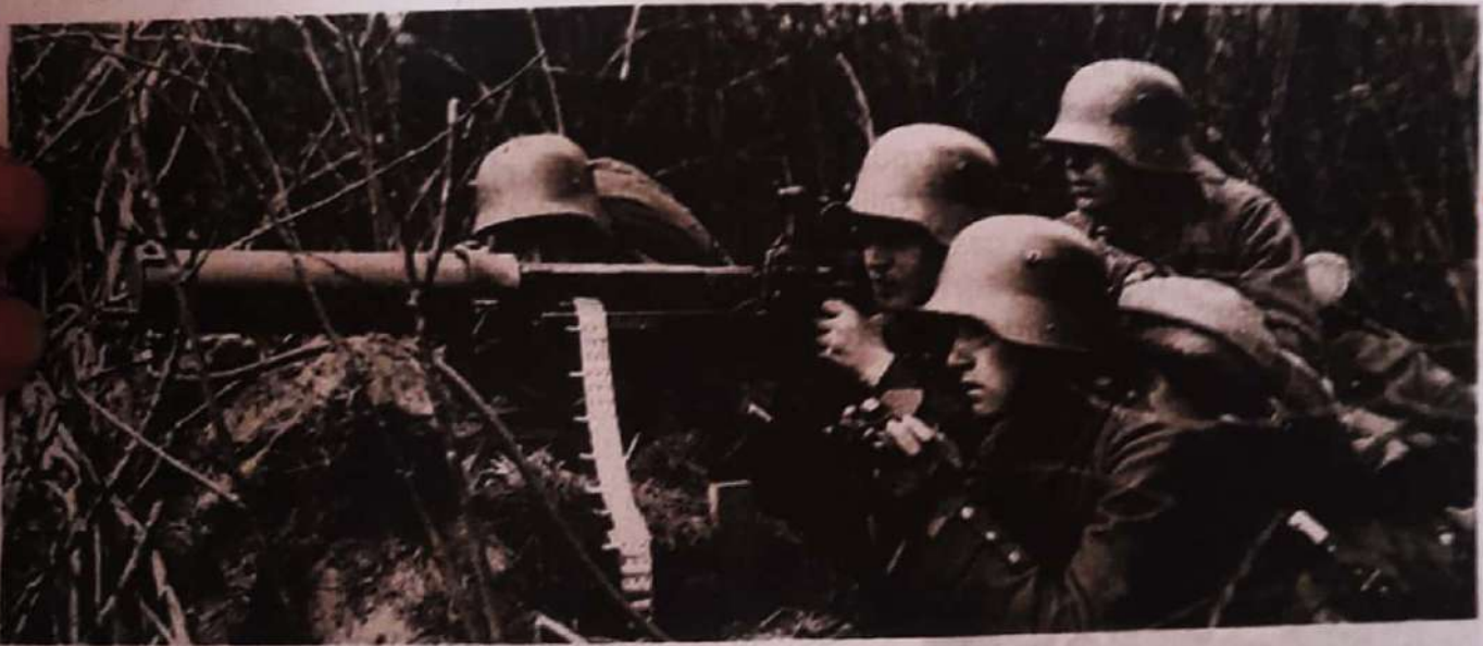
Imagen de la primera guerra