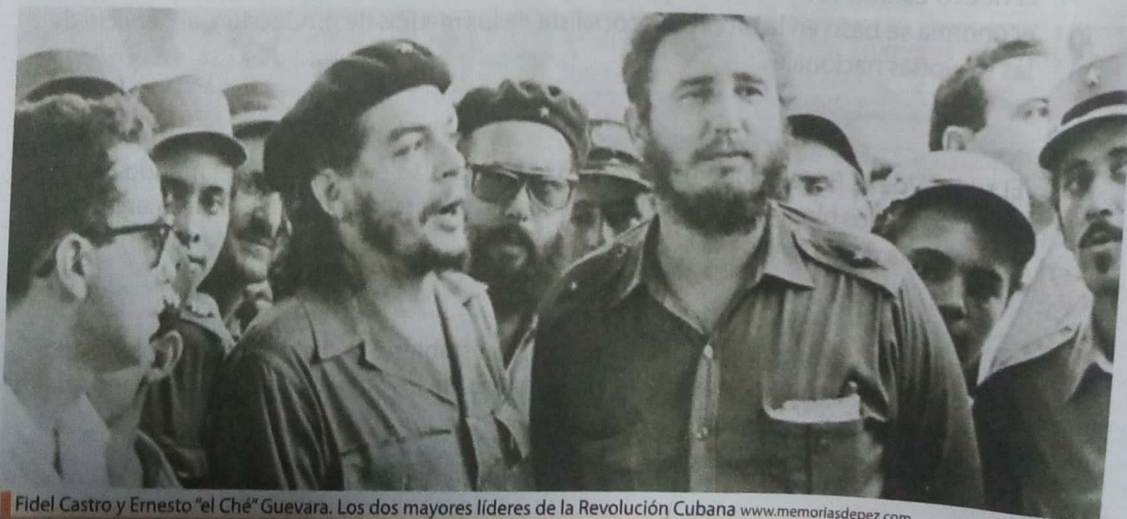
Fidel Castro y Ernesto "el Ché" Guevara. Los dos mayores líderes de la Revolución Cubana