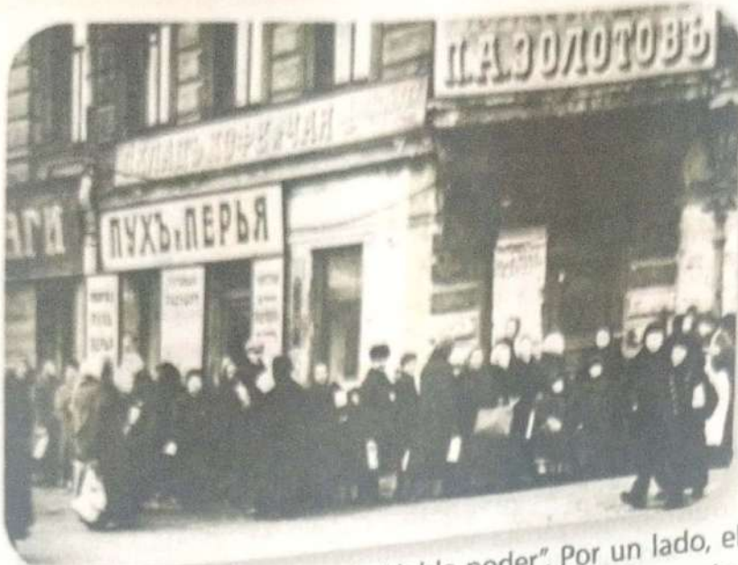
Cola del pan a comienzos de 1917 en Petrogrado. El creciente desabastecimiento desencadenó las protestas que desembocaron en la revolución

Rusia vivió una situación de "doble poder". Por un lado, el Gobierno provisional controlado por los liberales moderados con el Partido Cadete como principal apoyo. Por otro lado, los Soviets que surgieron por toda Rusia y que estaban dominados por los mencheviques y los socialistas revolucionarios.