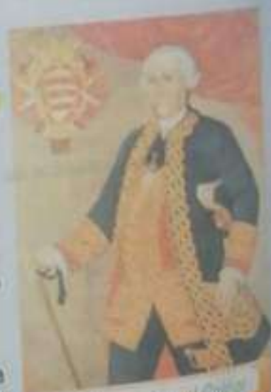
El Virrey Manuel Guinor

Fue notable la influencia ejercida por los ilustrados, en Nueva Granada a lo largo del siglo XVIII, siendo en el virreinato el principal referente de esta corriente de pensamiento; José Celestino Mutis.