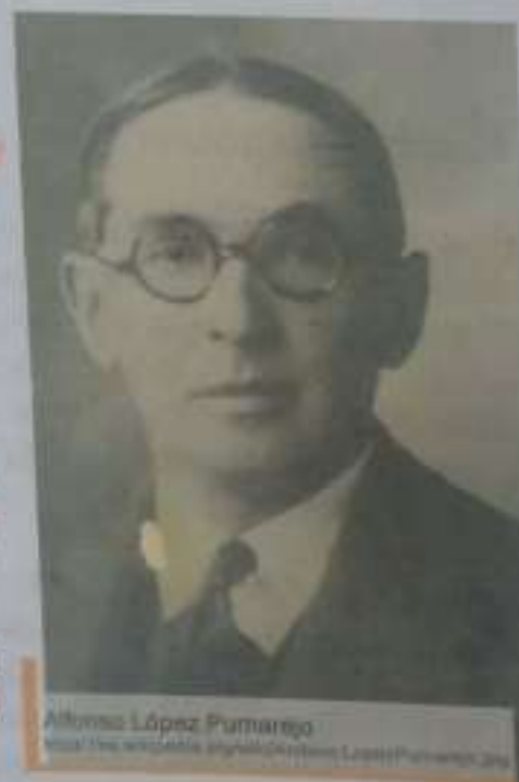
Alfonso López Pumarejo https://es.wikipedia.org/wiki/Alfonso_L%C3%B3pez_Pumarejo