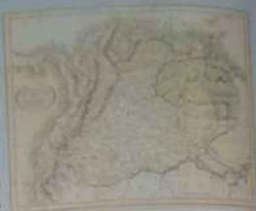
Mapa del Virreinato de Nueva Granada

La Corona se vio obligada a constituir este nuevo virreinato, por dos razones principales: era la zona más importante de producción aurífera y su estratégica posición le permitía enfrentar con efectividad el contrabando y la piratería. La ciudad de Bogotá, pasó a ser la capital del nuevo virreinato, convirtiéndose de esta manera en uno de los principales centros de actividad de las posesiones del imperio en América.