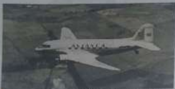
Avianca, primera aerolínea fundada en América y segunda en el Mundo después de la Holandesa KLM. https://www.avianca.com/turizado/?query=legre%20prensa%20guatemala%20

El sector agropecuario fue fortalecido por medio de créditos auspiciados por la Caja Agraria e igual sucedió con la industria gracias a la creación del Instituto de Fomento Industrial.