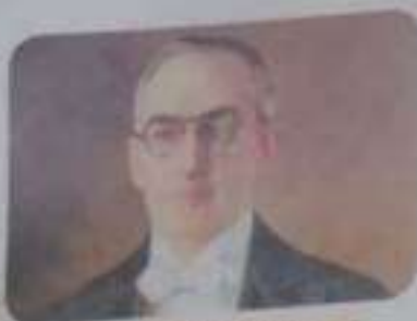
Alfonso López Pumarejo https://www.dinero.com/

El partido liberal gobernó durante 16 años, época que se conoce como la República Liberal y durante la cual el país sufrió importantes reformas en su sistema social y político.