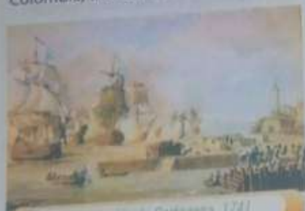
Siteo inglés de Cartagena, 1741

Su fundación obedece a la nueva política borbónica de reorganización administrativa y de reforma y modernización de los sistemas de extracción y comercialización de materias primas obtenidas de las colonias. De existencia intermitente, el Virreinato de Nueva Granada fue disuelto y vuelto a formar en numerosas ocasiones: tras su primera fundación en 1717, fue disuelto por dificultades económicas; fruto de la derrota española en la guerra de la Cuádruple Alianza (1718-1720), en 1724; refundado en 1740; disuelto por los independentistas que se hicieron con el poder en 1810; recuperado por Fernando VII en 1816; y finalmente, reemplazado por una nueva entidad, la Gran Colombia, tras ser definitivamente disuelto por los independentistas en torno a 1822.