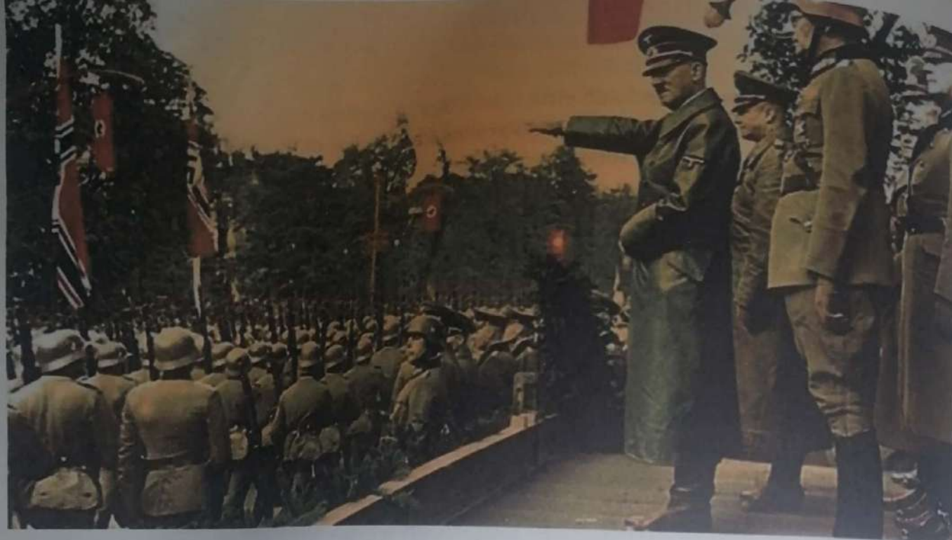
Hitler en la Segunda guerra Mundial