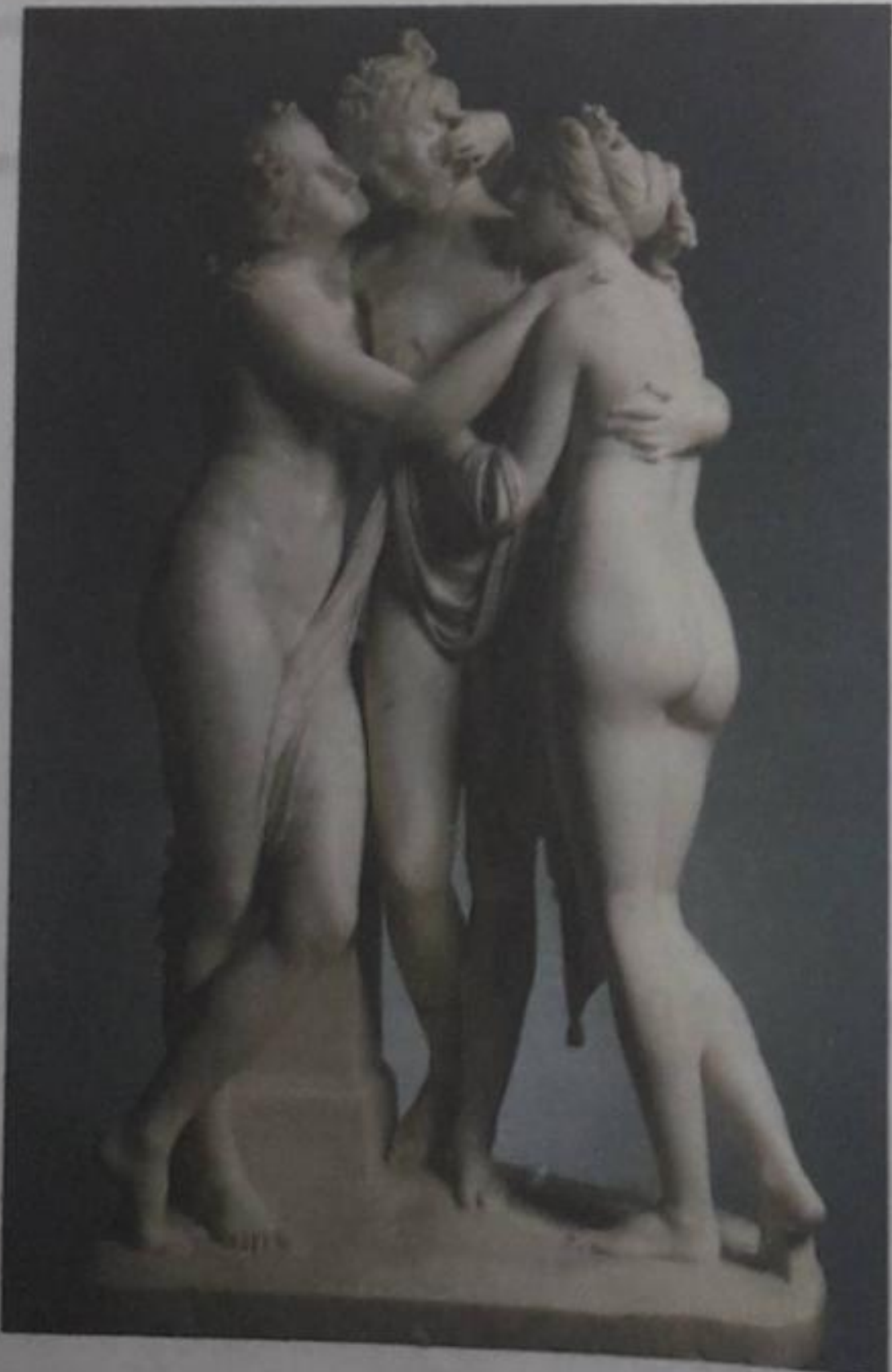
Las tres gracias, de Antonio Canova

4 Completa el siguiente cuadro expresando tu opinión acerca de la siguiente obra.