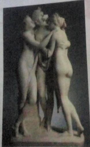
Las tres gracias, de Antonio Canova

Completa el siguiente cuadro expresando tu opinión acerca de la siguiente obra.