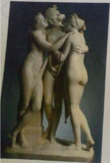
Las tres gracias, de Antonio Canova

4 Completa el siguiente cuadro expresando tu opinión acerca de la siguiente obra.