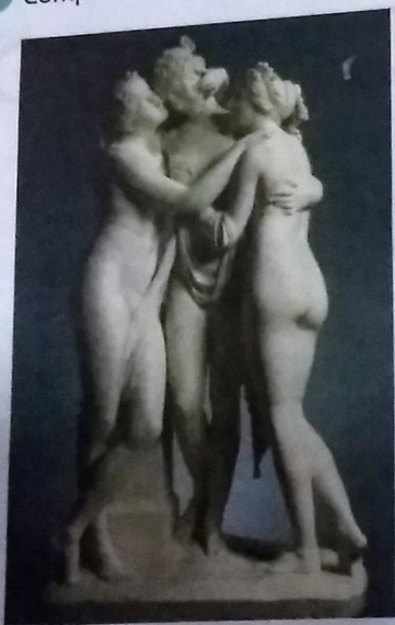
Las tres gracias, de Antonio Canova

4 Completa el siguiente cuadro expresando tu opinión acerca de la siguiente obra.