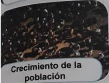
Crecimiento de la población

• Las aguas, tierras y aires se contaminan causando que la fauna y la flora no progrese