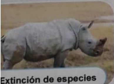
Extinción de especies

• Alteraciones en el clima causan que haya un declive de fauna y flora