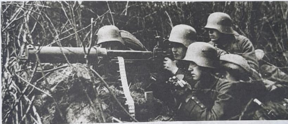
Imagen de la primera guerra