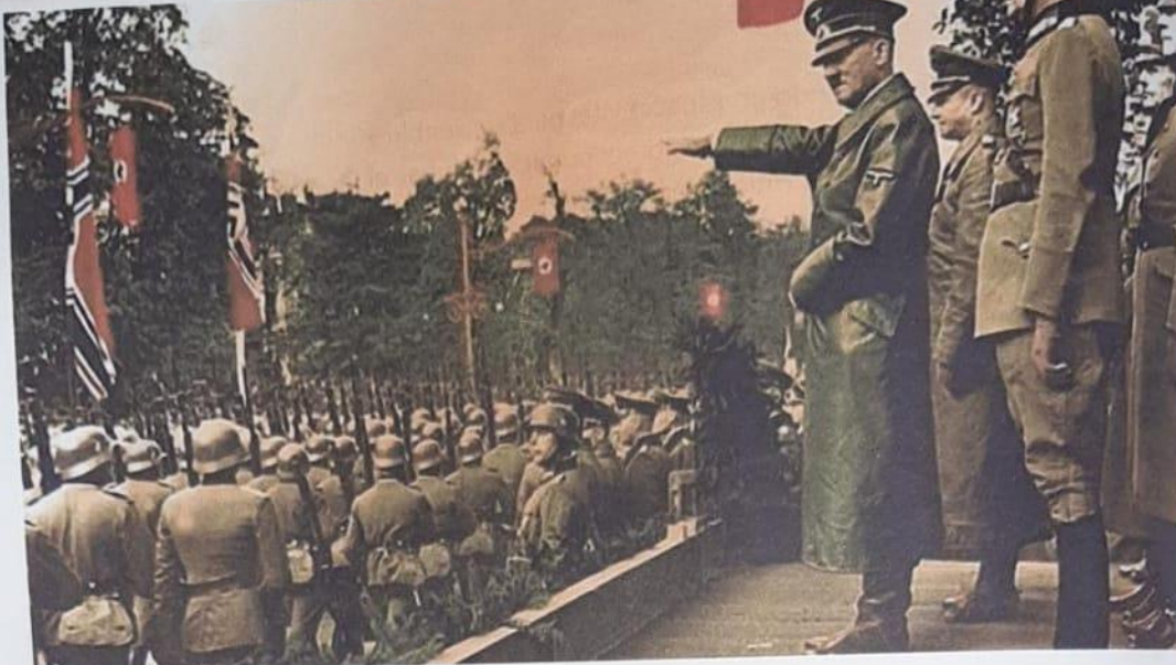
Hitler en la Segunda guerra Mundial okdiario.com/curiosidades/5-datos-aterradores-segunda-guerra-mundial-661331