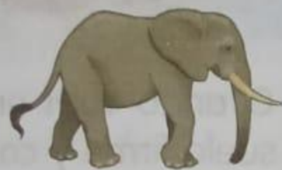
Elefante 3 Metros