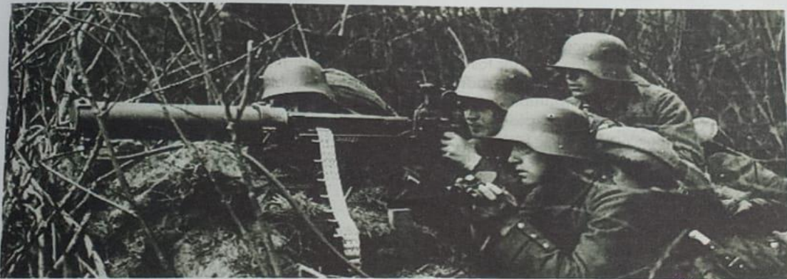
Imagen de la primera guerra