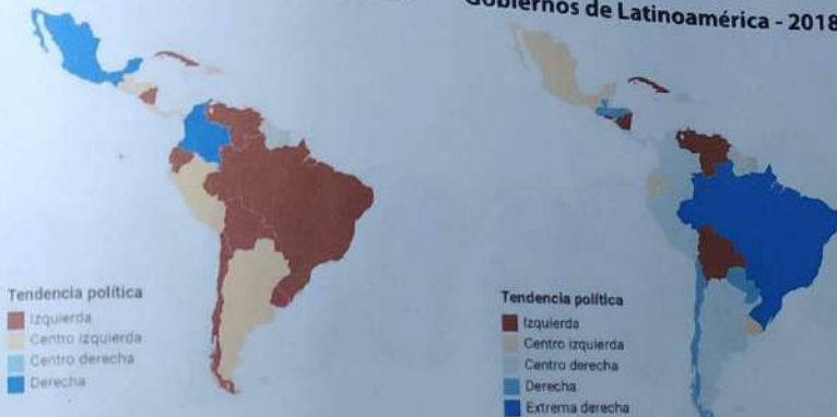
Gobiernos de Latinoamérica - 2018