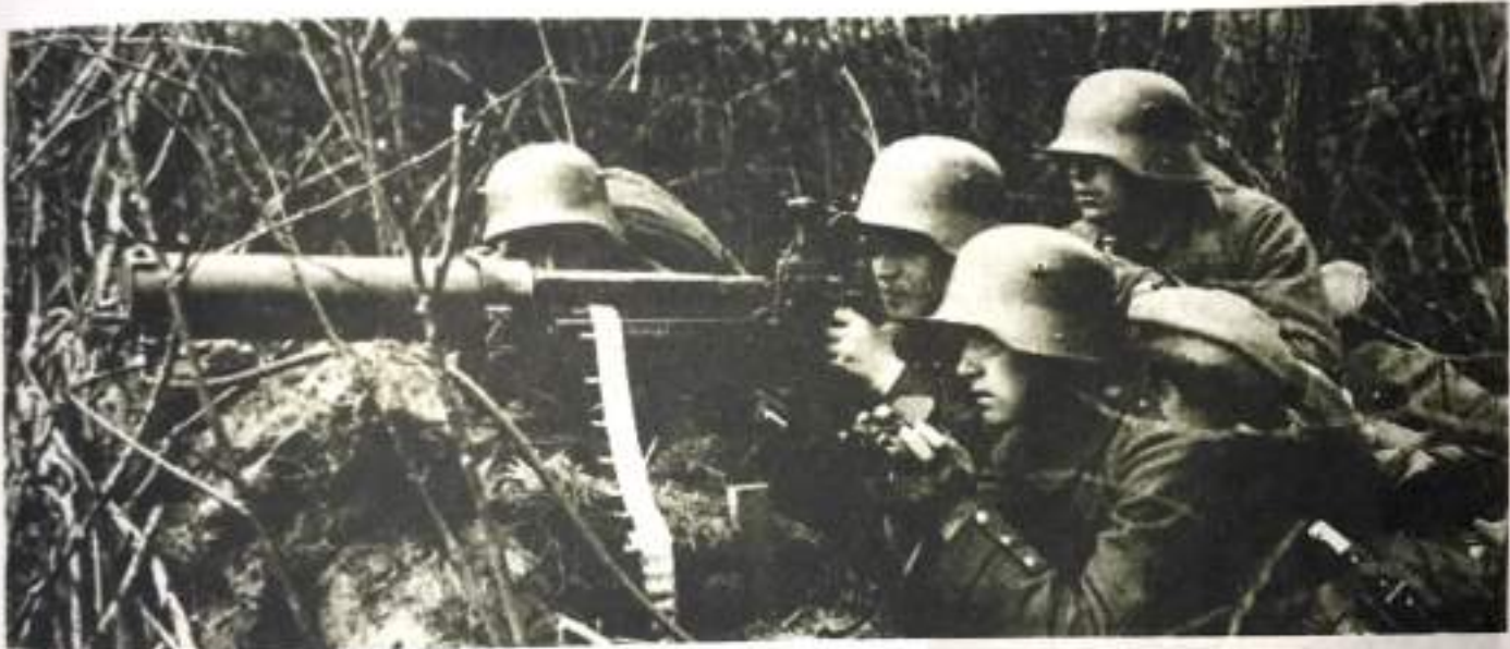
Imagen de la primera guerra