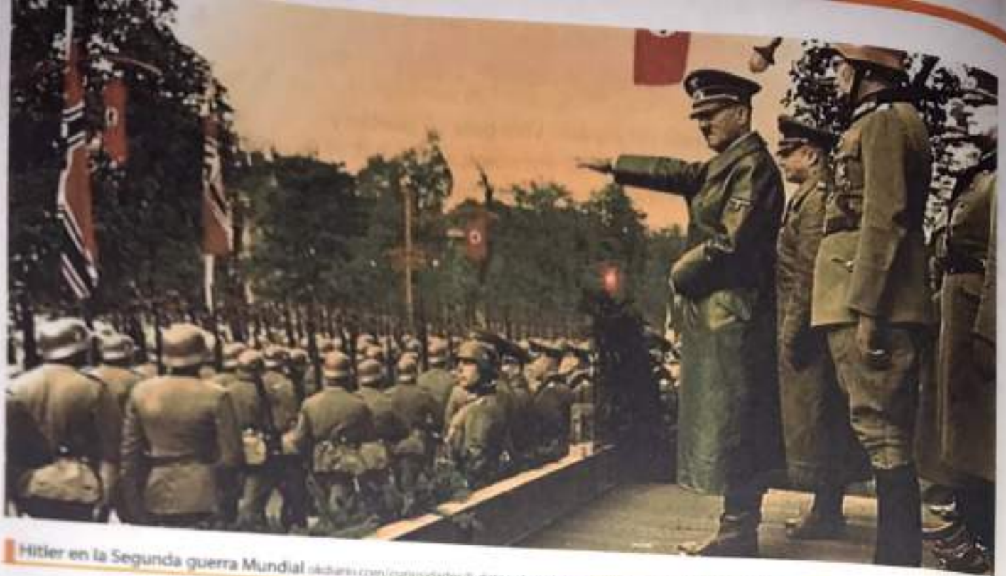
Hitler en la Segunda guerra Mundial