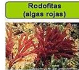
Rodofitas (algas rojas)