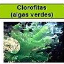
Clorofitas (algas verdes)