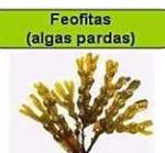
Feofitas (algas pardas)